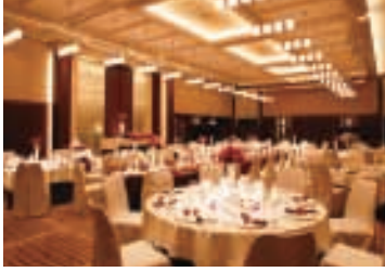
ハynesホール [2F] ニューヨークスタイルッシュをコンセプトにシックで落ち着いた造りのホールです。