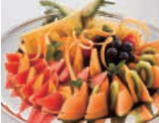
フルーツ盛り合わせ お一人様 500円～