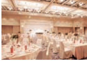
エンブレスホール [2F] 白を基調にヨーロッパモダンテイストの明るい雰囲気のホールです。