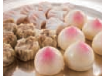
蒸し点心三種盛り合わせ お一人様 500円