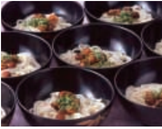
稲庭うどん お一人様 500円