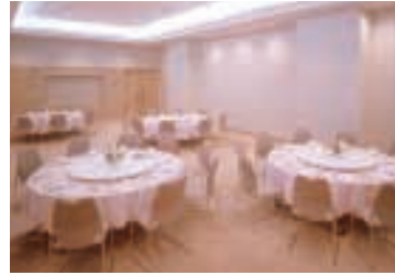
クリスタルルームA～D [2F] エメラルドルームA～D [3F]