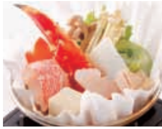
寄せ鍋(個人盛り) お一人様 1,000円