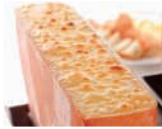
ラクレットチーズとポテト1台 38,000円 (約50名分)