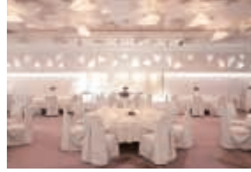
リージェントホール [2F] シンプルシックな造りで、様々なコンセプトに柔軟に対応できるホールです。