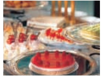
デザートbuffet(コーナー料理) お一人様 500円～