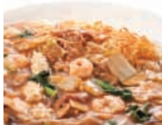
五目あんかけ焼きそば お一人様 500円