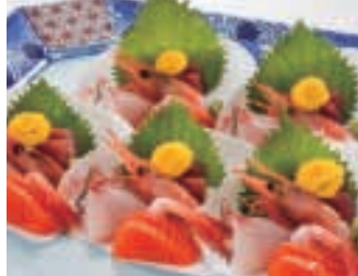
刺身盛り合わせ お一人様 800円～