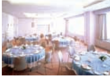
パールホール [20F] 明るい日ざしと夜景の灯りを目の前に開放感溢れるホールです。